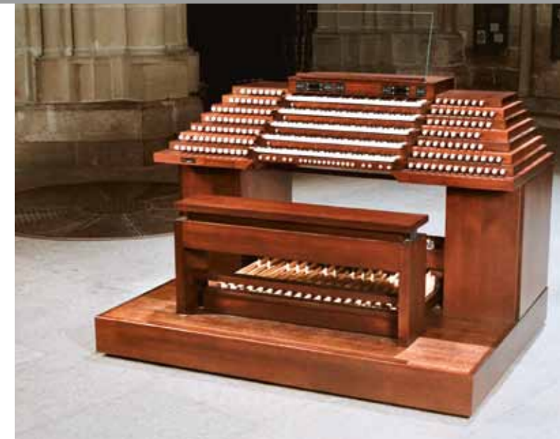
GIUGIARO DESIGN, ESQUISSE DE LA CONSOLE ET DU BUFFET, 2001.

l'instrument en accueille quatre. L'apparence de l'instrument traduit donc sa modernité. L'originalité du buffet se manifeste par divers éléments: > une structure en trois corps, composée de deux grandes tourelles latérales – comprenant à leur base, derrière les grands tuyaux de façade, les deux claviers positifs – et d'un corps central constitué de la console de tribune et du clavier de bombarde placé devant le clavier du récit; > le dessin du corps central (buffet de bombarde), sur les chamades; > la présence de panneaux de verre à la base de l'instrument, éléments qui peuvent être éclairés de manière diffuse.